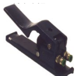
MANETA BITUBO LARGA 401-143