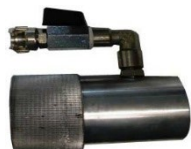
460-101 Dispositivo simple de 1"1/2 para mang. Ø 40mm y boquilla longitud 75mm