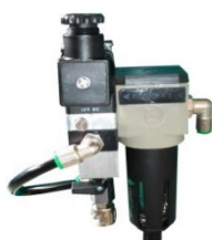
BLOQUE PILOTO CON FILTRO Y ELECTROVALVULA 401-180