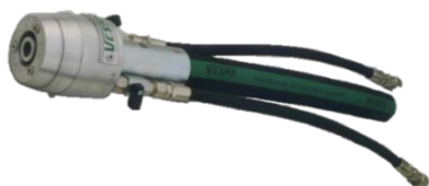
460-100 Mezclador completo de porta-boquilla para mang. Ø 40mm y boquilla longitud 75mm