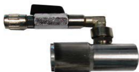
460-102 Dispositivo simple de 1" para mang. Ø 25mm y boquilla longitud 40mm