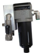
BLOQUE PILOTO CON FILTRO 401-178