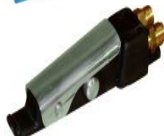
MANETA BITUBO SMALL 401-145