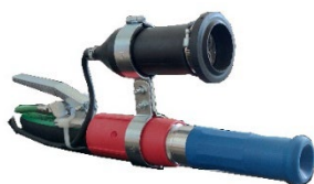
920-300 Faro a led para lanza de chorreado