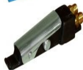
MANETTA BITUBO SMALL 401-145