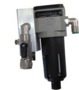
BLOCCHETTO PILOTA CON FILTRO 401-178